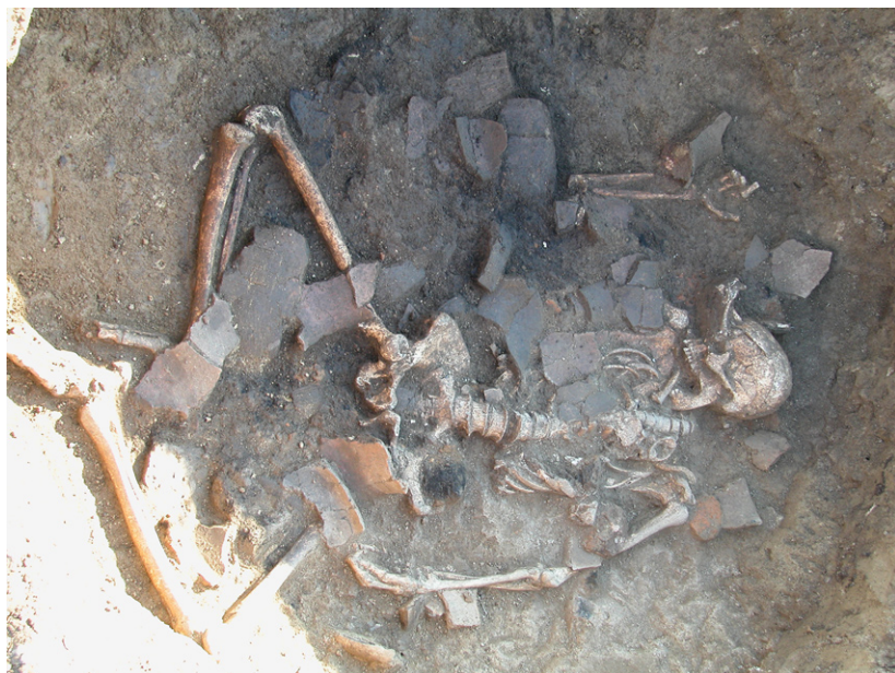
Középső bronzkori szemetesgödör eltemetett csontvázal.

A bronzkor középső szakaszában régióinkban három jelentős kultúra is megtalálható. A Harang alakú edények kultúrája területileg a legnagyobb, mivel a mai Angliától Portugáliáig, keletre a mai Budapestig őrzi nyomait. Nevét harang alakú, bepecsételt díszítésű edényeiről kapta. Jellegzetességei továbbá a csónak alakú, cölöpszerkezetes házak, a hamvasztásos temetkezési szokás mellett megjelent a korhasztásos rítus is. Vas megyében a korszakban a Rábától nyugatra a Gáta-Wieselburg-kultúra virágzott. A mai Ausztria és Csehország középső bronzkori településeivel kapcsolatot tartó kultúra temetkezési szokásáról tudható, hogy a 30-40 szabályos sírcsoportból álló temetőkhöz halottaikat nem hamvasztották, hanem „alvópózban” (oldalra fektetve, mellkas felé felhúzott lábbal) helyezték el a sírokban. Az elhunytak mellett eszközöket, ékszereket találtak: a férfiak mellé bronztört, nyakukra bronz nyakperecet tettek, a nők ékszerei csigahéjakból, kagylókból, bronzgyöngyökből, csüngőkből készültek. A kultúrához tartozó zsenneyi kavicsbányában feltárt 23 sír azt is megmutatta, hogy a különböző társadalmi réteghez tartozókat más-más mennyiségű és anyagú tárgyakkal temették el. A „vezetőt” temették a legtöbb