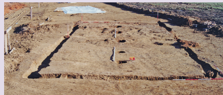
Lengyeli ház Szombathely határából.

A Metro áruház területén feltárt két ház gerendaárkokból és középvonalban elrendezett szelemenekből állt, amelyek a hagyományos nyeregteret tartották. A ház keleti irányból nyitott részét valószínűleg az állatok részére építették. A településen a lakóházak, egy kisebb melléképület, tárológödörk és szemetesgödörk mellett térben jól elkülönülő hármasság körárcot találtak. Ez feltehetően a település lakóinak szakrális tere lehetett.