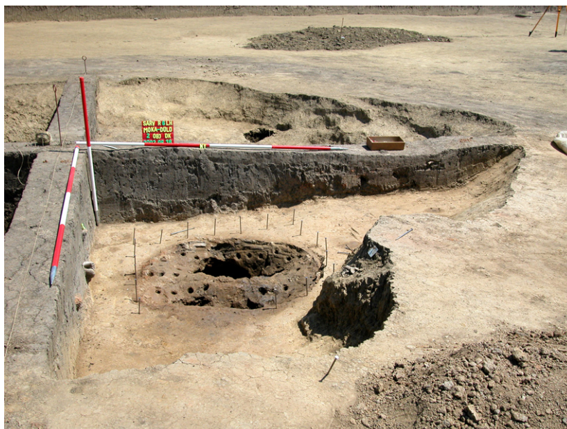
Kelta félig földbe mélyített műhely edényégető kemencével.

A kelta időszak utolsó szakaszában a magaslati telepeken virágzó, „városias” jellegű központok jöttek létre. A Kr. e. 1. század végén és a Kr. u. 1. század elején törés alakult ki az addig virágzó törzsek életében. Nagyszabású építkezések zajlottak a magaslati településeken, amelyeket sáncokkal erősítettek meg, többek között a velemi Szent Vid-hegyen lévő lakhelyet. A kelták hanyatlását belső és külső harcok okozták, a végső csapást a rómaiak pannóniai megjelenése jelentette, amely egyben a több ezer éves őskor történetét is lezárta.