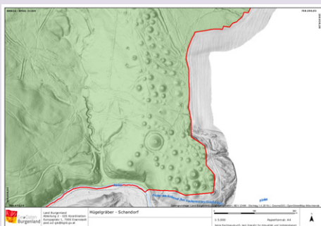
A Schandorf-i halomsírok. LandesGis Burgenland ( https://gis.bgld.gv.at )

A Schandorf, Badersdorf, Felsőcsatár, Vaskeresztes, Burg és Eisenberg határában lévő hatalmas kiterjedésű halomsírmező több csoportból álló, közel 420 halommal rendelkezik. A római korhoz köthető 90 darabon kívül a többi a Hallstatt-kultúra időszakára datálható. A Schandorf határában lévő halom alatt kővel kirakott sírkamrában egy férfi elhamvasztott maradványait és gazdag tárgyi mellékletet találtak. A nagyméretű fekete és vörös festésű, bikafejes füffel díszített urnák mellett olyan jellegzetes bronz ruhát is előkerült, amelyek alapján megállapítható, hogy a halottat Kr. e. 620 és 500 között helyezték a sírba. Az ArcheON projekt keretében a sírmező kutatása, részleges feltárása történik meg.