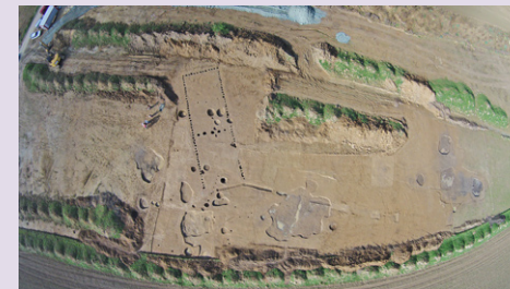
Az Unterloisdorf-i lengyeli ház.

A feltárás során egy nagyméretű ház került dokumentálásra. A hosszú ház formája alapján mind horizontálisan, mind vertikálisan osztott térrel rendelkezett, elkülönült a közösségi tér, a privát élet-tér, valamint az állatok helye. A cölöplyukak alapján, melyek a fal vonalában szorosan egymás mellett sorakoztak, két tartóelemtípust lehetett megkülönböztetni. A hármasságban álló cölöpkötegekből kettő a felső padlást - ahol valószínűleg a gabonát és szálas takarmányt tárolták -, egy, a nagyobb és mélyebb cölöpök magát a tetőt tartották. A középső szelemenek óriási méretei (közel 80-100 cm széles és 150 cm mély) is a ház nagyságával magyarázhatóak. Az egyik cölöplyukból előkerült idoltöredék párhuzamait a Szombathely területén megtalált szórványos idoltöredékben láthatjuk.