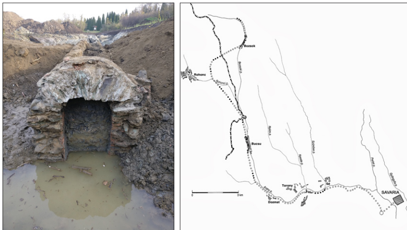
Római vízvezeték Savaria határában, a római vízvezeték nyomvonala.

Az ArcheON projekt keretében az aquaeductus régészettörténeti szempontból legjelentősebb szakaszának (Dozmat) feltárására kerül sor, amelynek eredményeként a keresztmetszeti és szerkezeti adatokból pontos számításokat lehet végezni az akkori lakosság vízellátottságára vonatkozóan. Az építéstörténeti kérdések mellett pedig irányának és helyzetének kutatásával tovább lehet pontosítani a csatorna – és ezáltal Savaria – történetét.