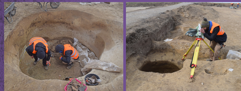
Régészeti feltárás, régészeti munkálatok.

Az emberiség történelmét, kultúráját a régészet a feltárt tárgyi emlékek módszeres vizsgálatával végzi. Az egyes régészeti korszakok meghatározása rendkívül összetett feladat, a fő korszakokat a felhasznált anyagok, technológiák, a használati és kultikus tárgyak formája, díszítése, az életmód határozza meg alapvetően.