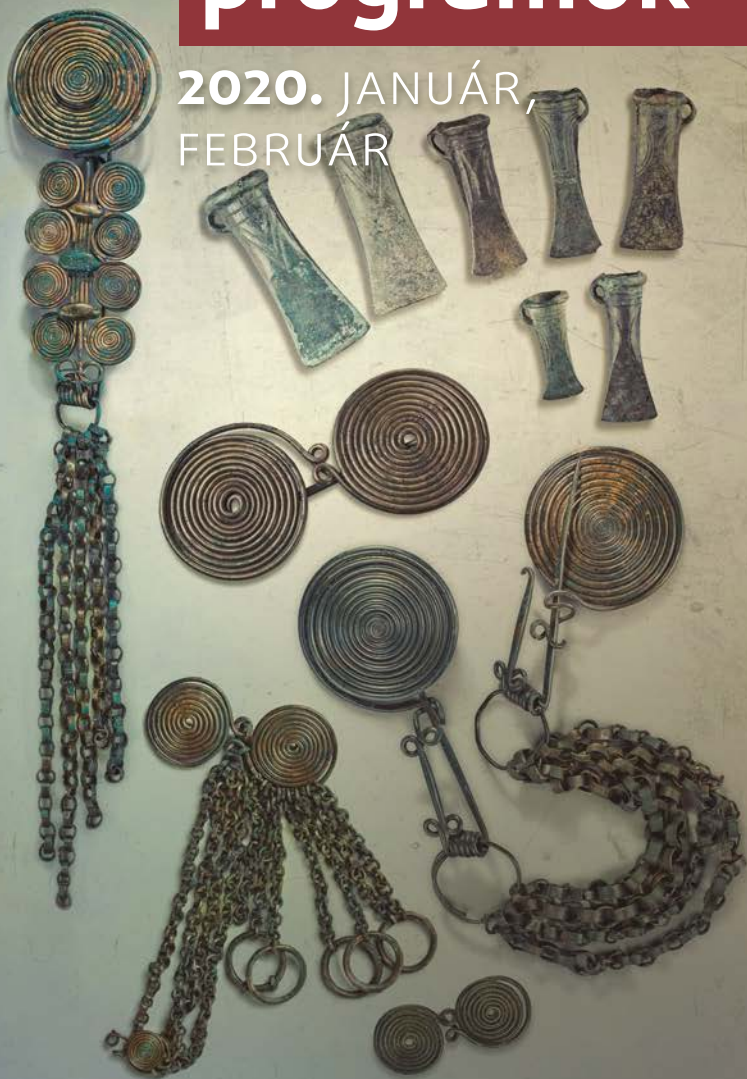
Pápaszemes- iker és láncos fibula, tokosbalták, fibulák