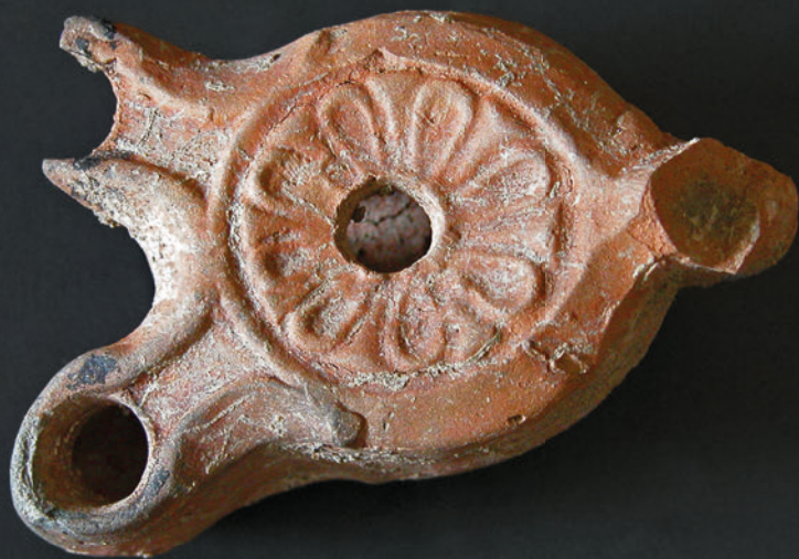
Az Iseum feltárása során előkerült kétlángú mécses (Kr. u. 2-3. sz.)